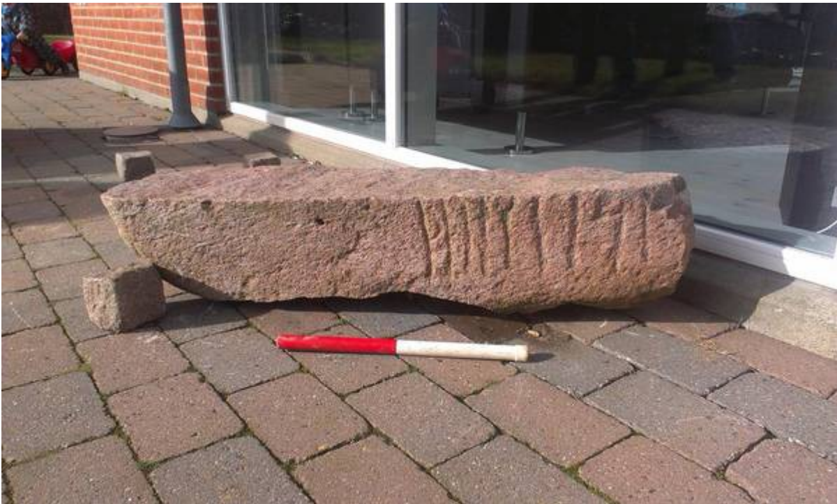
Fragment af Ydby-runestenen med runer, der danner navnet 'TROELS. Runestenen har været forsvundet i mere end 200 år, men er nu dukket op igen i en haveterrasse i Boddum i Thy.