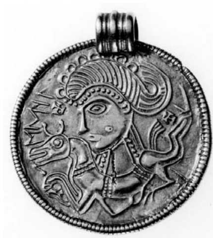
G 251. Foto: Gabriel Hildebrand 1997.