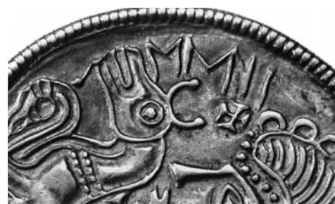
G 251. Detalj av inskriften. Foto: Gabriel Hildebrand 1997.