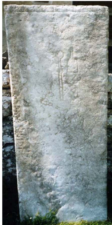
G 250.

Samtliga runor är osäkra. Inga säkra spår återstår av det lilla likarmade kors som enligt de äldre avbildningarna inledde inskriften längst upp till höger, längs övre kortsidan syns svaga rester av 6-8 runor före 1 i . Efter 15 r följer ett långt parti där rester av runor kan skönjas här och var, däribland 16 þ och 17 s , därefter runorna 18-22. Efter runa 22 i finns inga spår av runor på den starkt vittrade ristningsytan. Dessa inskriftsrester ger inget språkligt sammanhang och de äldre läsningarna visar att inskriften varit praktiskt taget utplånad redan omkring 1800.