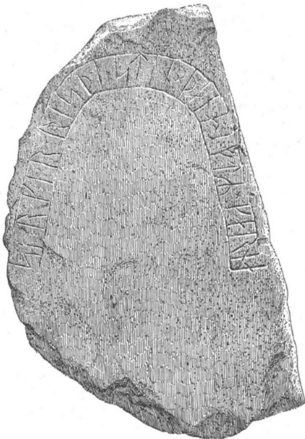
2. Ög. 67. Ekeby.