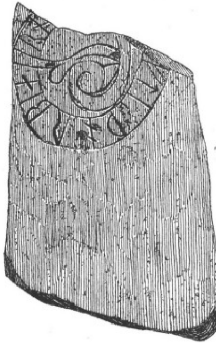
KÄLLA. 56 C.