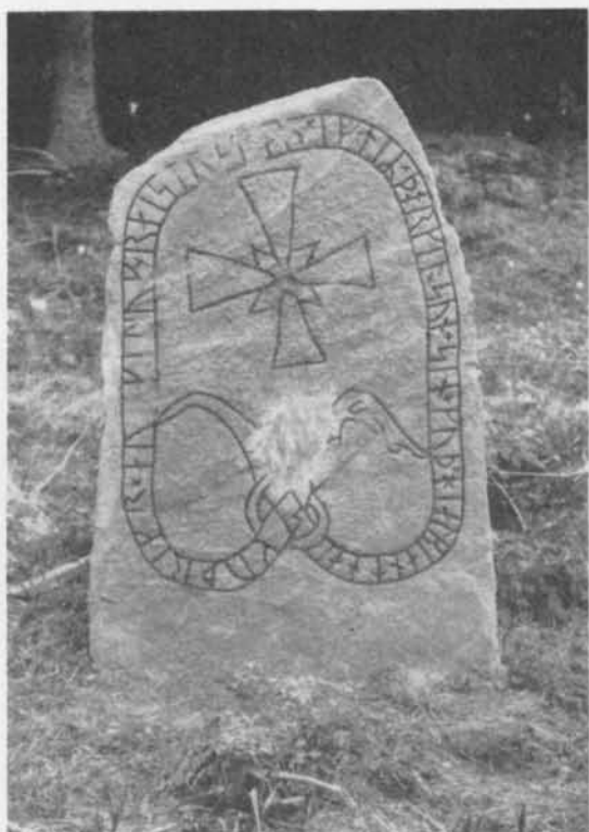
Fig. 2. Billbystenen, S:t Pers socken, Uppland.  1955. — The Billby stone, St. Per parish, Uppland.