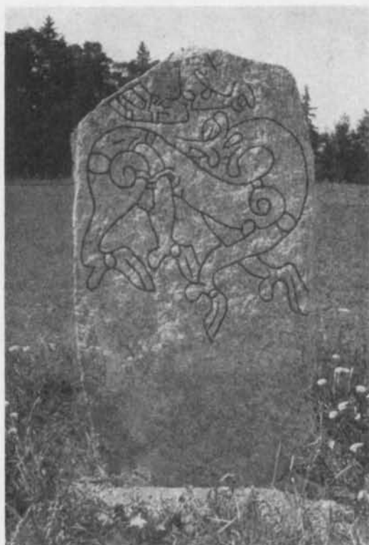
Fig. 5. Rybylundstenen, Kungs-Husby socken. Foto förf. 1955. — The Rybylund stone, Kungs- Husby parish.