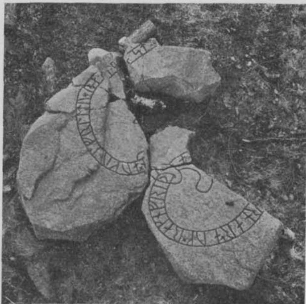
Fig. 1. Sex av de sju sammanhörande runstensfragmenten vid Hagby gård (Lissby), Täby sn, Uppland, hoplagda på marken. Ristningen är ifylld med svart vattenfärg. — Six of the seven related fragments of runestone at the Hagby (Lissby) farm in the parish of Täby, Uppland. The carving is filled with black water-colour.

C: 38 × 33 cm. Tre med stenkitt sammanfogade bitar. Passar samman med fragment B. Runslinga: [r]ais.