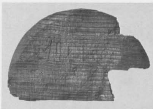
Fig. 4. Runristad laggskålsbotten från kv. Stallbacken i Nyköping. — Rune-carved base of wooden bowl from Nyköping.

Vid arkeologisk undersökning i samband med byggnadsschaktning har en fragmentarisk laggskålsbotten tillvaratagits (fyndnr 1933), på vilken några ristade