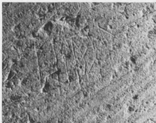
Fig. 1. Runinskrift på korportalens i Eke kyrka, Gotland. — Runic inscription on the chancel porch of Eke Church, Gotland.