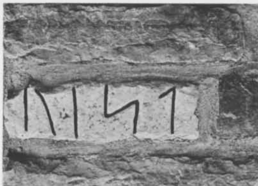
Fig. 9. Det återfunna runstensfragmentet Ö 48, Köpings kyrka, Öland. – The rediscovered runestone fragment Ö 48, Köping Church, Öland.

På en »antikvarisk» resa 1797 konstaterade C. G. Helfeling vid sitt besök i Köpings kyrka, att det »Uti Söd Östra Hörnet af Östra Tornet ut åt Kyrkogården Syntes, nedre vid jorden, en kant af en inmurad Runesten . . .» Senare uppgifter om den fragmentariska runstenen Ö 48 saknas; förmodligen försvann den, då den medeltida kyrkan revs 1805 och en ny byggdes.