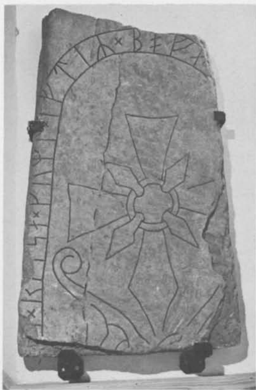
Fig. 3. Den återfunna runstenen Sm 163, Arby kyrka, Småland. Foto H. Gustavson (ATA). – The rediscovered runestone Sm 163, Arby Church, Småland.

Att namnet Bofi uppträder i runinskriften är inte direkt överraskande. Förutom i