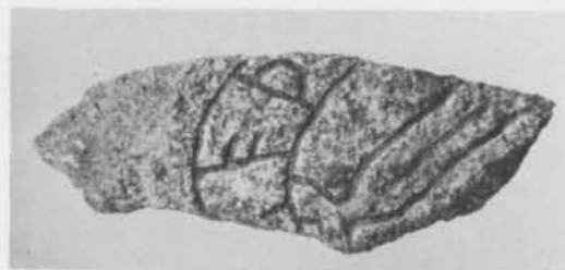
Fig. 7. Runstensfragment från Össeby kyrkoruin, Össeby-Garns socken, Uppland. – Runestone fragment from the Össeby Church ruin, Össeby-Garn parish, Uppland.

fats i S:t Pers kyrkoruin och att de »ligga i kyrkan». Sedan 1888 förvaras sex av dessa i Statens historiska museum (SHM inv. 8272:3) och har publicerats som U 397 i Upplands runinskrifter . Fragmentet kommer att införas i museets inventarium.