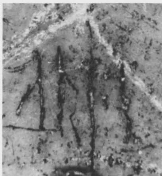
Fig. 3. Fotografi av ristningen i ungefär dubbel skala. — Photograph of the inscription (scale appr. 2:1).