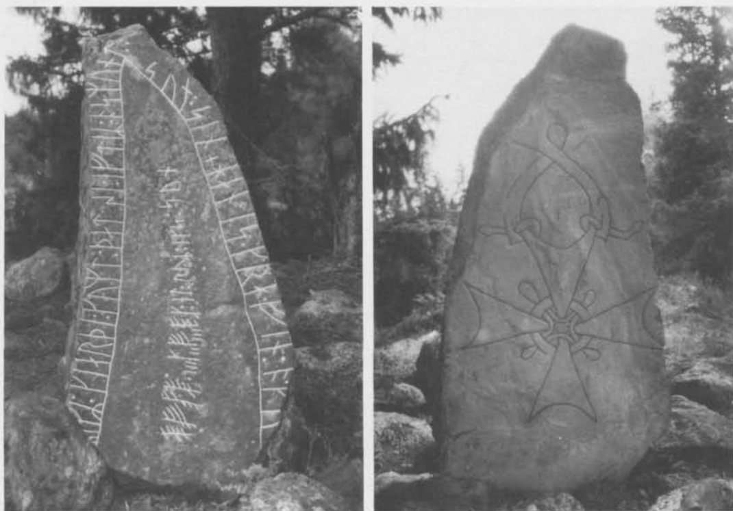
Fig. 3. Runstensens båda sidor. – The two sides of the runestone.

Genom att uppföra ett minnesmärke med ålderdomlig form kommer det förflutna och nuet att bringas närmare varandra. Detta öppnar möjligheter att manipulera innehållet i det förflutna. Det nyuppförda röset kommer genom sina likheter med bronsålderstida rösen att influera tolkningen av de senare. Rösen från det förflutna kan härigenom fungera som bekräftelse på de innebörder som det vikingatida röset uttrycker. På detta sätt reaktiveras arvet från det förflutna och fylls med nytt innehåll.