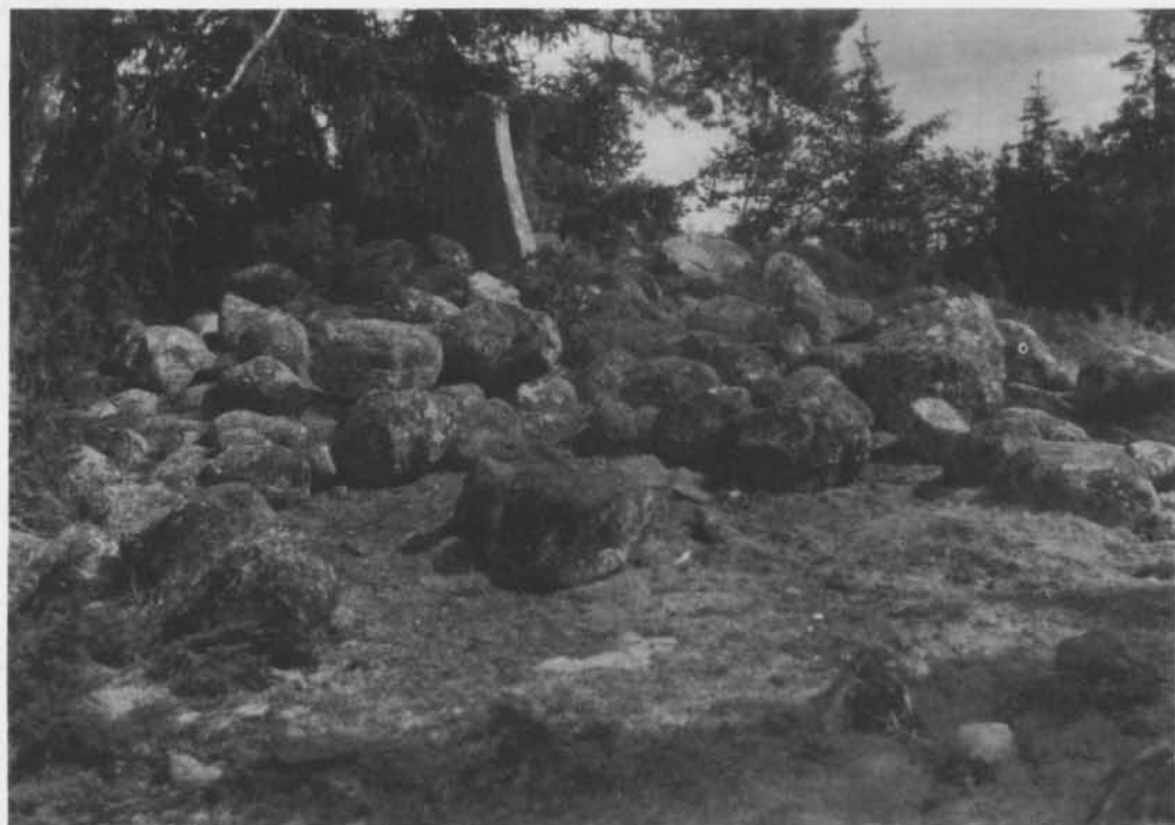
Fig. 1. Röset med runstenen Sö 47, Vålsta, Nykyrka socken, Södermanland. – The cairn with the runestone.