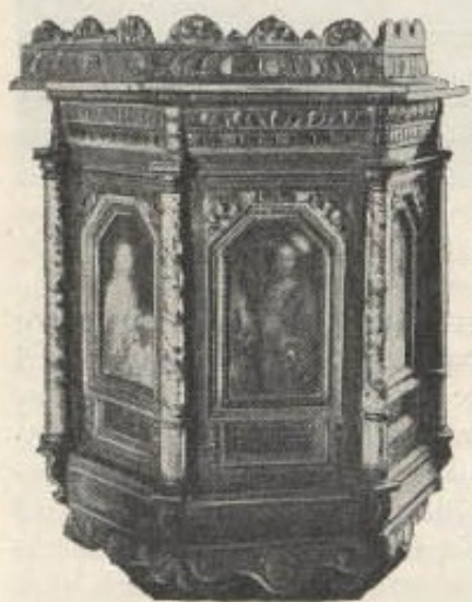
Prekestol fra Alens gamle kjerke omkr. 1700.

Den eldste altertavle er fra 1600-tallet. Den er inndelt i tre felter. I det til venstre er øverst et bilde av Johannes Evangelist som holder ei bok, og av en fugl. I midten er et bilde som forestiller Isaks ofring. Under dette bilde står: «Abraham ist Gott gehörsam und wil seine einige Son Isaac . . . .» (resten borte). Nederst: Lucas Evangelist sitter med ei bok i handa og har to andre liggende ved siden; dessuten står et dyr ved siden av evangelisten. I det midterste felt står øverst et bilde