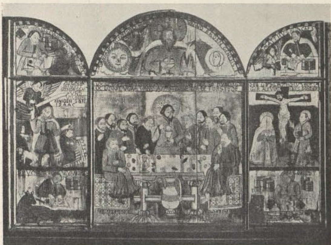
Altartavlen fra 1600-tallet.