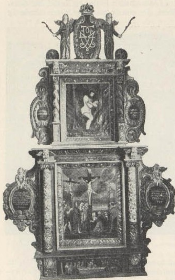
Altertavlen fra 1705.

en ældre kirkes reisverk. Skibet i den ældre kirke blev benyttet som kor og det gamle kor som sakristi. I aabningen mellem koret og sakristiet var indsat en portal som formodentlig fra først af har staaet i den gamle kirkes vestre væg, der blev nedtaget da det nye skib opførtes. Den gamle kirkes ydre vægflader var nu afpudsede med ler som dækkede alle sammenføininger. Ved nedtagelsen blev det sikkert at kor og sakristi var den gamle uforandrede reisverkskirke, hvori hjørnestolper, sviller og raftstokker endnu var godt bevarede. Af vægplankerne var ogsaa en del ubeskadiget. I ingen af plankerne saaes spor af de almindelige runde