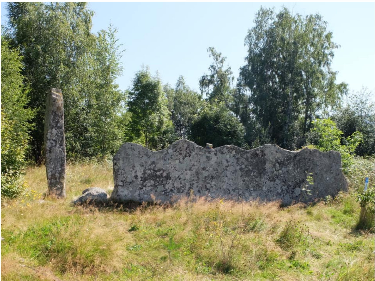
Figur 3. Gåra kirke i Bø i Telemark, nedrevet 1850. Av kirken, som skal ha vært Norges eldste kirkebygg anlagt på et gammel gudehov, står i dag kun gapestokken (bautastein)