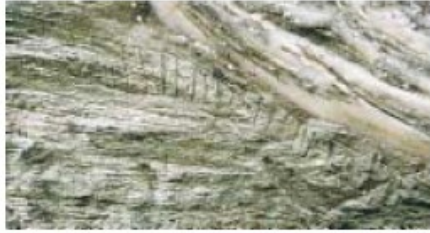
Esøy, innskrift nr. I. Bogeforma innskrift med 'boge over'.

innskrifta forma som ein boge eller eit dyrehorn, for det andre på innskrifta sjølv, som er skriven i ein boge (sjå bildet over).