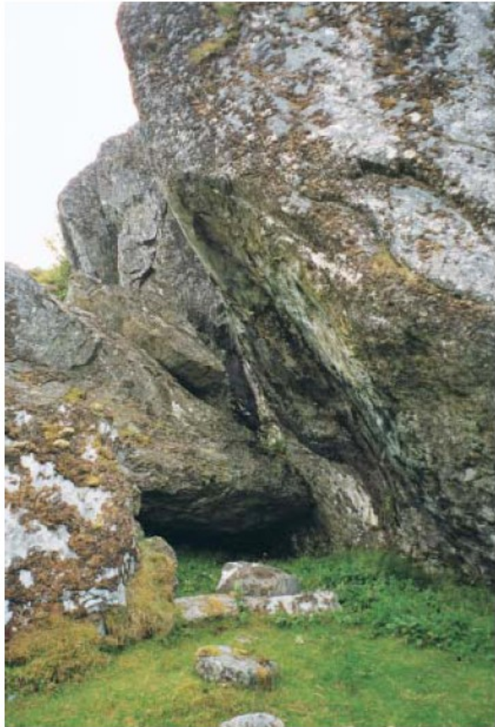
Ein skrånande bergvegg gir ly for innskrifta.

Rune 1-4 kan altså utan særleg tvil lesast som ÞRIR (= þork). Rune 5 er den mest usikre. Her er øvre og nedre del av staven godt nok bevart, men på grunn av forvitring i berget er ein del midt på ikkje så godt synleg lenger. Litt nedanfor midten er det eit noko større utfall av metallhaldig masse i berget. I ytterkanten av denne forvitringa synest det på både sider av staven å vera spor etter eit snitt, truleg restane av ein kvist som har kryssa staven i stigande retning frå venstre opp mot høgre. Etter alt å dømma har rune 5 såleis vore ei æ-rune (æ). Over nivået for denne sannsynlege kvisten er det ei fordjuping i bergoverflata i retning frå staven og opp mot høgre. Denne gir ein skuggekontur ved avfotografering, men synest ikkje å vera