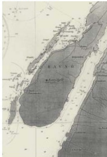
Esøya ligg utanfor Hamnøya i Vevelstad kommune på Helgeland.