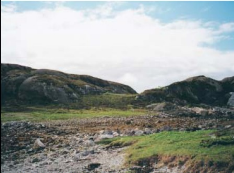
Oversiktsbilde over klebersteinsveggene på austsida av den vesle Esøya.