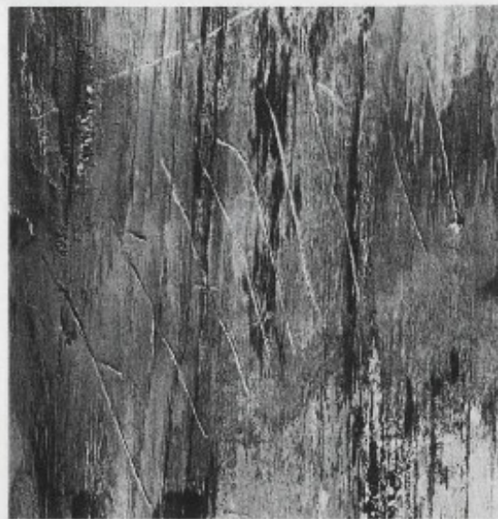
3. (over) Dei uforståelege runene i koret. 4. (under) Pater noster-innskrifta på kordøra.