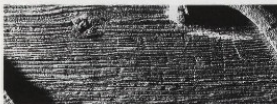
6. Restar av runeinnskripta på hovudinn-gangsdøra.

forvitra og for største delen, unnateke slutten, uleselege (sjå fig. 6). Det står: ??????(ur) ??n:sin. Med runer vart skiljeteikn, oftast dobbelpunkt som her, brukte som regel mellom kvart ord i ei innskrift. Her er siste ordet truleg ei form av "sin", dvs. at innskripta nok har vore på gammalnorsk, ikkje latin. Meir kan diverre ikkje seiast.