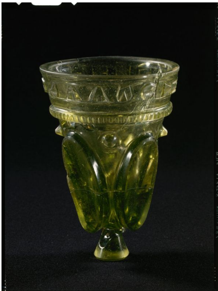
Drikkebægeret med runer i bunden.

For første gang nogensinde er der fundet runer på en lergenstand fra jernalderen i Danmark. Indskriften består af tre runer, som danner ordet »alu«. Det er et af de mest almindelige ord på genstande fra 300-400-tallet efter Kristus og samtidig det mest omdiskuterede. Den hidtil ukendte runeindskrift dukkede op under registrering af fund fra en udgravning af en jernalderlandsby ved Uglvig øst for Esbjerg. Det var en jernalderlandsby, sådan som landsbyer var flest i 300-400-tallets Jylland.