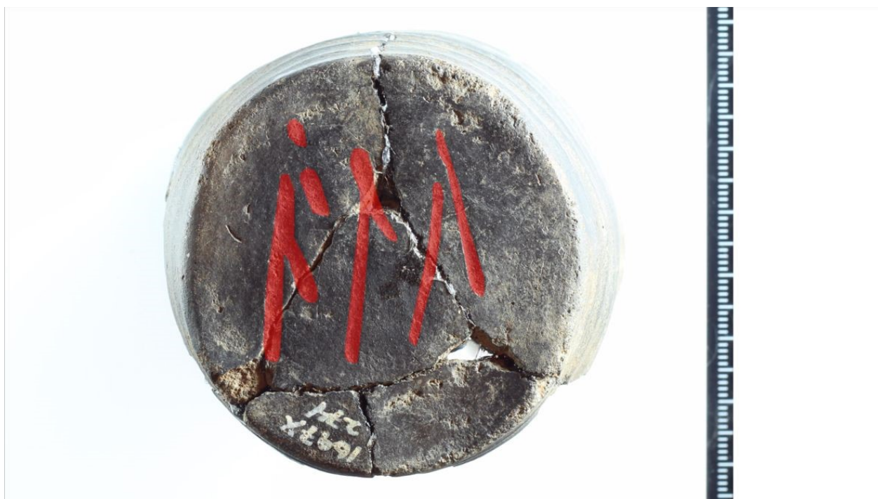
På bunden af drikkebægeret står der »alu«.

Man har aldrig før fundet runer på lergenstande fra jernalderen, men nu er det sket. Et drikkebæger fra Uglvig nær Esbjerg har runeindskriften »alu«. Det har sandsynligvis betydet øl eller skål.