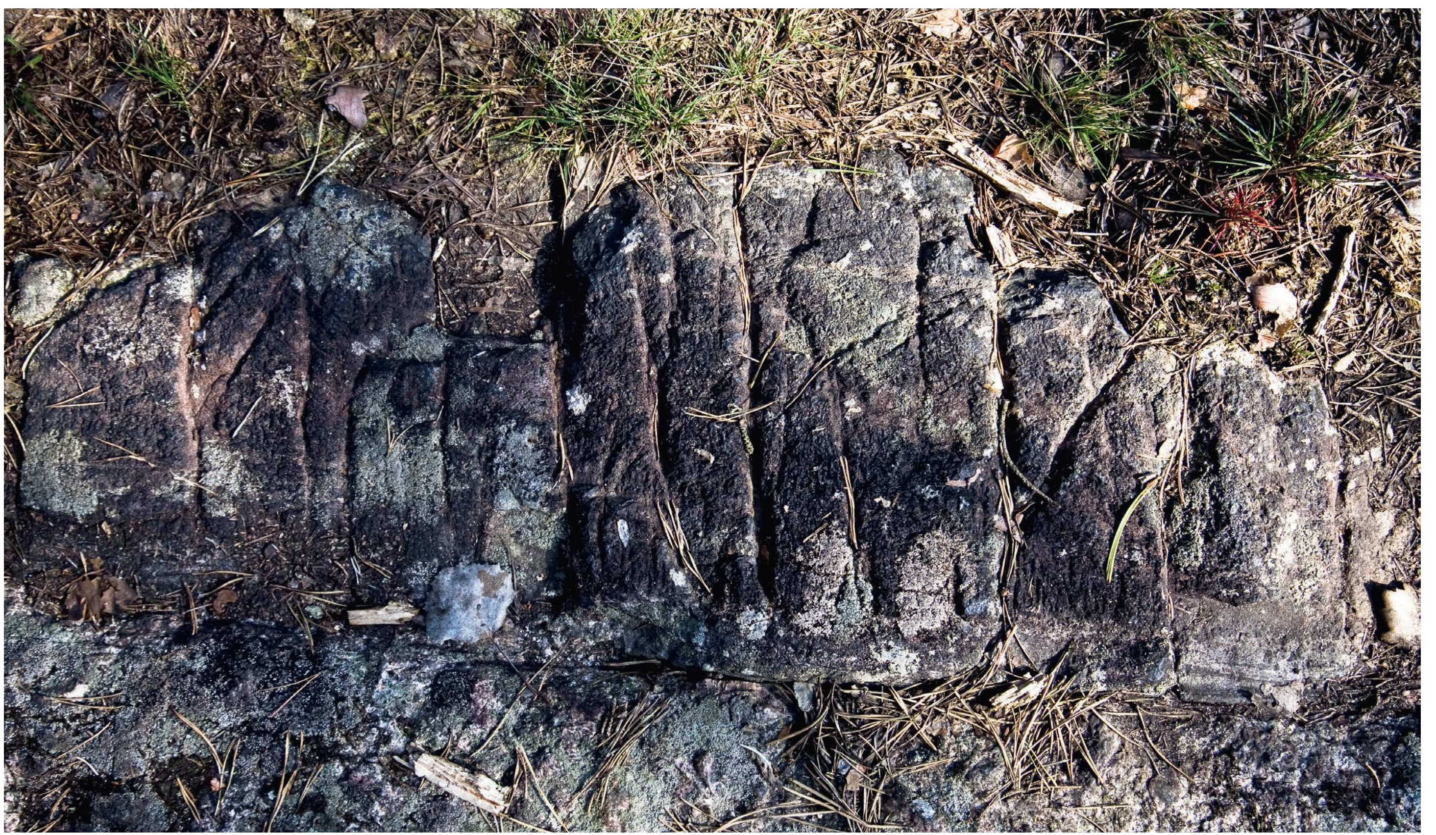
Runamoristningen enligt Finn Magnusens tolkning.

Diabasgångarna uppstod i samband med starka rörelser i jordskorpan för omkring 900 miljoner år sedan. I de sprickor som bildades trängde magma från jordens inre upp och stelnade. Diabasgångarnas bredd kan variera från några millimeter till över 200 meter. Diabasen är en nästan helsvart bergart och kallas ibland för svart granit.