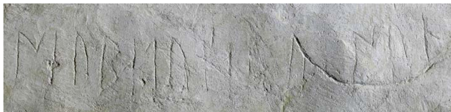
G 394c. Foto: Bengt A Lundberg 2003.