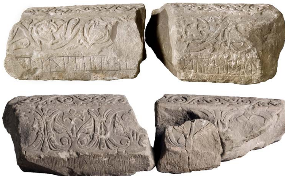
G 226. De bevarade fragmenten av den kistformiga gravhällen. Överst framsidan med runor, nederst baksidan med endast ornamentik. Foto: Bengt A. Lundberg 2007.

Till läsningen: Inskriften börjar vid fotändan. Av runa 1 återstår toppen av en huvudstav. Därefter skiljetecken i form av ett kolon. I 2 l saknas nedre tredjedelen av huvudstaven. Basen av 3 i är bortflisad. 7 e är stungen med en liten men tydlig punkt på huvudstavens mitt. 9 a har dubbelsidiga bistavar. 10 s har formen h. Av runa 11 återstår drygt nedre hälften av en huvudstav. Av 12 a återstår vänstra bistaven och ett stycke av huvudstavens mitt. Resten av runan bort i fragmentets brottkant. På det 3 cm långa partiet av ristningsytan till vänster om 14 b finns inga spår av runor. En punktartad fördjupning till vänster om toppen av 14 b är naturlig. Av 14 b återstår drygt övre hälften av huvudstaven och hela övre bistavsågen och övre ansättningen mot huvudstaven av den nedre bistavsågen. Basen av huvudstaven i 15 t är