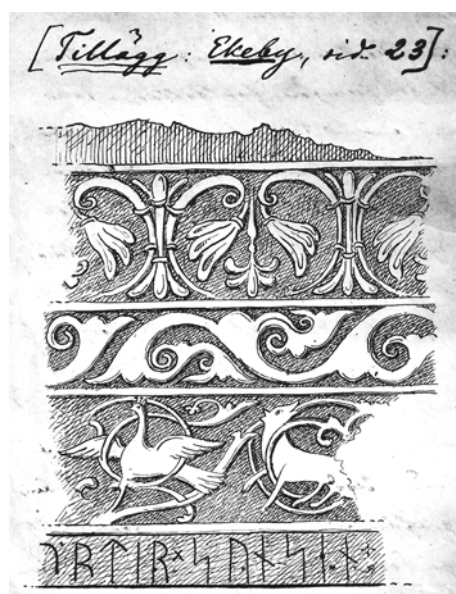
G 226. Teckning av P. A. Säve 1864.

De äldsta uppgifterna om och avritningarna av det fragmentet som påträffades 1865 ger P. A. Säve i R 623:4, s. 659 och i S 170:5, nr 5 samt i Reseberättelsen 1864. Den utförligaste beskrivningen återfinns i Reseberättelsen: ” Runsten (af sandsten), fragment, 1 aln lång, 16 tum bred och 10 tum hög (eller tjock), den ende Runsten på Gotland (jemte den i Sproge [G 69], som är af sandsten - funnen i April 1865 uti botten af en graf i sydvestra delen af Ekeby kyrkogård; och är a) [syftar på Säves avbildning] med dess 2 ne stående, 2 ne curva och ena liggande fält, en framställning af detta Runstens-fragment (hvilket dock icke är så jemnt, utan brustet och skrofligt i begge ändarne), samt b) [syftar på Säves avbildning] en genomskärning af detsamma. Förmodligen har detta stympade block i sin helhet varit en Grafsten af denna här på Gotland alldeles ovanliga form.”