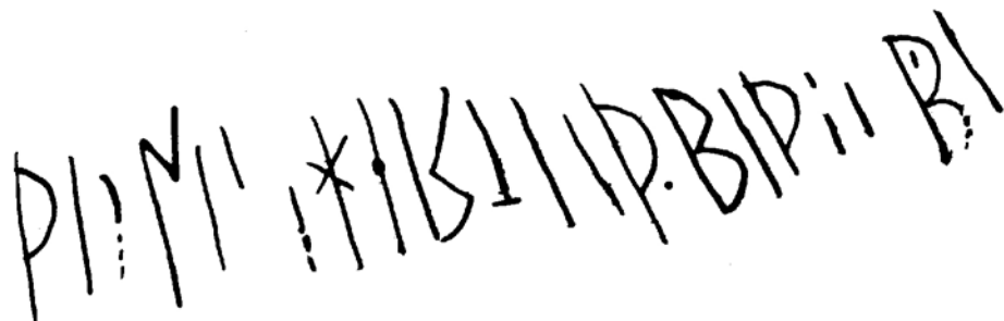
G 394b. Renritning: Helmer Gustavson.

Till läsningen: Basen av 2 u borta i en liten flagring. Övre delen av bistaven kan inte med säkerhet iakttagas. Tredje ledet i 3 s ristat snett uppåt höger. Efter 3 s anas tre ytterst grunda och diffusa lodrät streck, av vilka det tredje möjligen är rester av en u -bistav. Genom detta parti