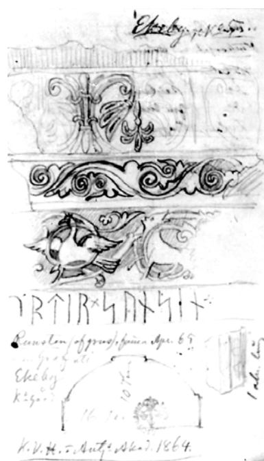
G 226. Teckning av P. A. Säve i S 170.

O. v. Friesen 1923: lit × kiera × s[t.... De då nyfunna fragmenten undersökte han inte närmare men anger i sin anteckningsbok den 30/7 1923: ”2 Fragment av gravsten av ljusgrå sandsten. Ett större med runor