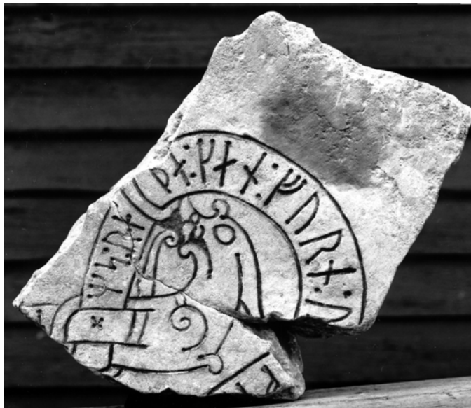
G 227.

Till läsningen: Runorna står fritt i inskriftsbandet med baserna inåt. Nästan alla huvudstavar och bistavar i inskriftens runor har borrarade punkter i sina spetsar. De är djupare än runornas stavar och har sannolikt tjänat som hjälppunkter, när runorna ristades. Sådana borrarade punkter förekommer på flera runstenar i bildstensform. Se Gotlands runinskrifter 2, s. 208. Inskriften inleds med ett skiljetecken i form av ett punktformat kryss vid rundjurets bål. Övriga skiljetecken i inskriften i form av kolon. 5 cm till vänster om skiljetecknet är den övre hälften av en punktförsedd huvudstav av runa 1 bevarad. Resten av runan har varit ristat på ett nu förlorat stycke av stenar, som har innehållit början av inskriften. Före 2 m finns inga spår av någon runa. Det som kan uppfattas som basen av en huvudstav är ena linjen i en tunn slinga, som