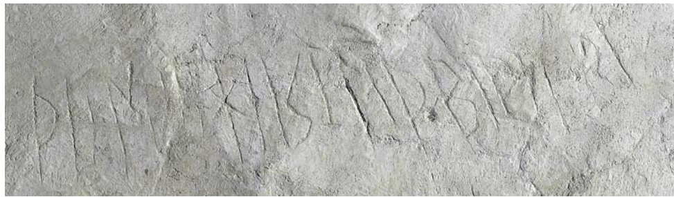
G 394b.