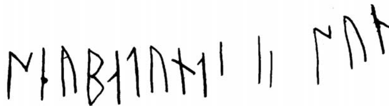
G 394c. Renritning: Helmer Gustavson.