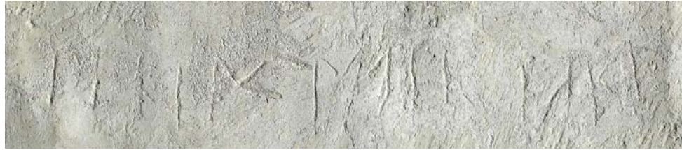
G 394a.