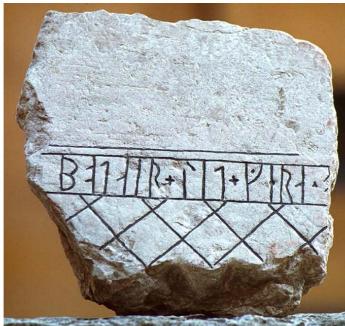
G 274. Foto: Bengt A. Lundberg 1996.

Till läsningen: Runa 1 b är ristad drygt 3 cm från den vänstra kanten. Övre delen av denna kant kan vara ursprunglig så det är möjligt att de bevarade runorna utgör inskriftens början. I 1 b är basen något skadad genom vittring. 2 o har ensidiga bistavar, snett nedåt vänster. I 3 t har huvudstaven inte ristats ända upp till den övre ramlinjen; den ensidiga bistaven utgår från runans topp. På huvudstaven finns två ojämna fördjupningar som bedöms vara naturliga. 4 a har ensidig bistav; t.h. om