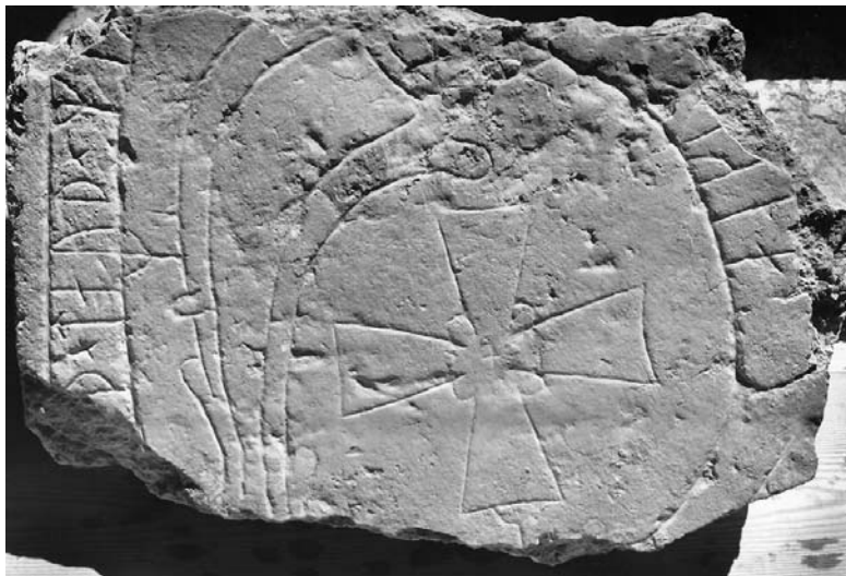
G 270.

Till läsningen: Runorna t , a och m har dubbelsidiga bistavar. 1 h och 3 k har förlorat ett litet stycke av huvudstavens bas. 2 e är liksom 12 e stungen med en ovanligt liten drillad punkt. 3 k är inte stungen. I 4 u är nedre hälften av runan bortfallen. Av runa 5 återstår en cm av