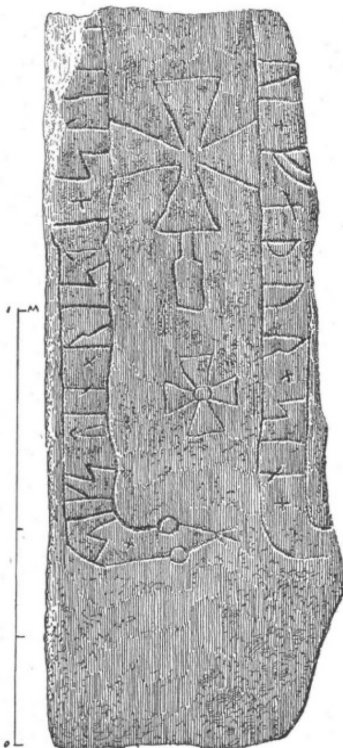
1. Ög. 13. Konungsund.

Runstenen är insatt liggande i stenfoten till Konungsunds kyrka på södra yttersidan, och redan Peringskiöld anger dess plats vara »I Konungsundz Kyrkiemuur». Ämnet är