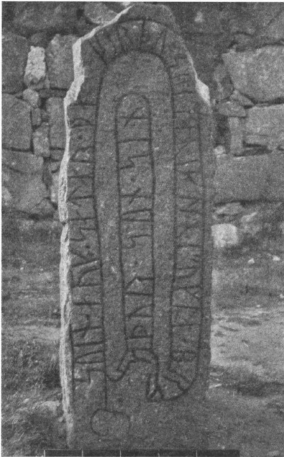
2. Ög. 147. Furingstad.