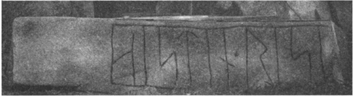
1. Ög. 193. Härberga, v. sidan.