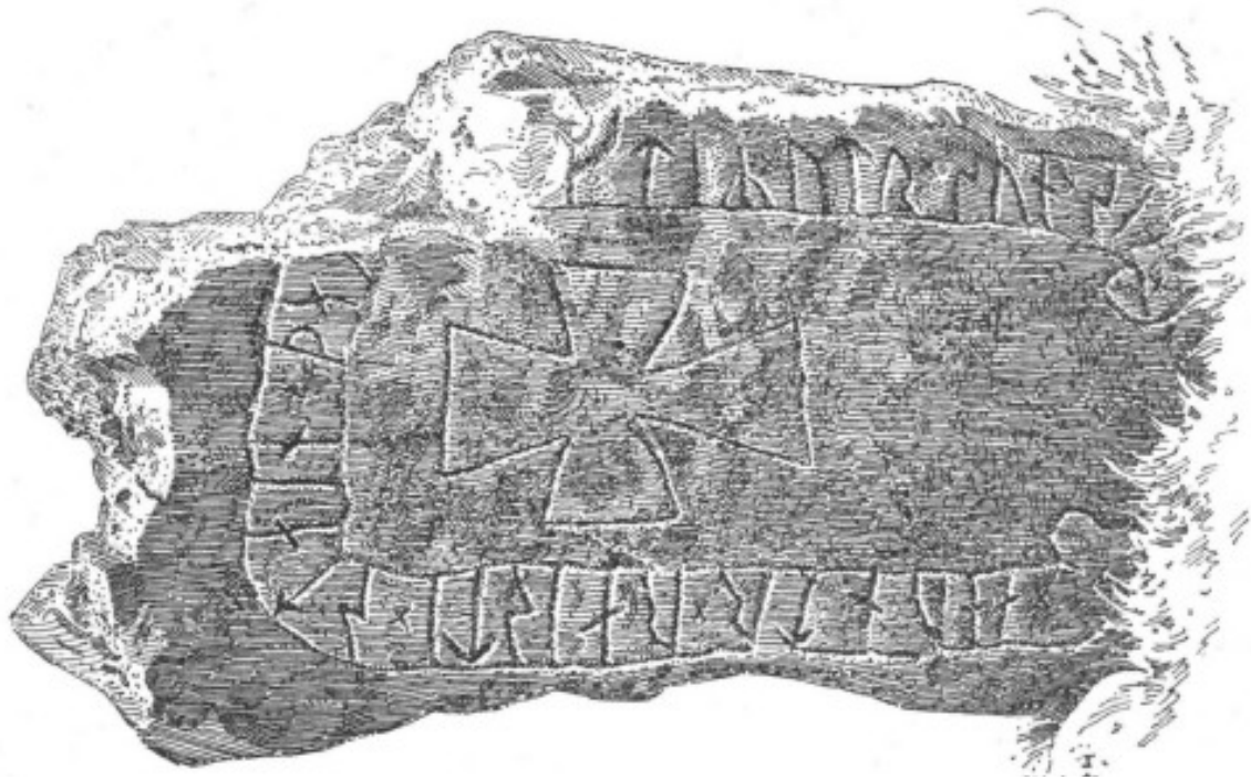
I. Ög. 26. Öster Skam.