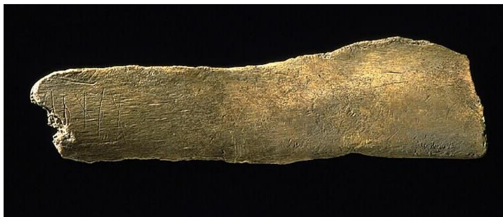
Fig. 1. Runbenet SI 42 från kv. Professorn 1.

Revbenets längd är 136 mm, bredd 36 mm och tjocklek 8 mm. Runhöjd 14 mm (5 p ).