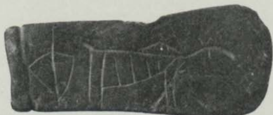
Fig. 1. 2/3.

På föremålets ena sida finnes en ristning av samma karaktär som de norrländska hållristningarna, 1 men det är första gången ett fynd göres av en dylik ristning på en liten lös stenplatta. Ristningen framställer till höger ett djur (alg?) till vänster ett föremål, som kanske kan tolkas som en fiskhåv. Härmed jämföres Th. Petersen, Litt om Frosta , fig. 6 i Frosta i gammal og ny tid , Trondhjem 1917, där författaren uppfattar en något likartad figur som möjligen ett "fiske-net". Samma tolkning kan