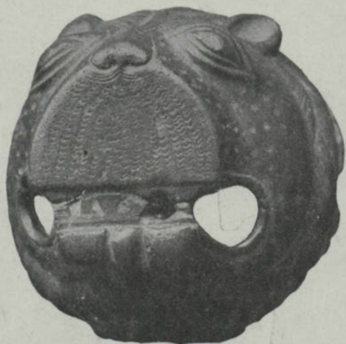
Fig. 5. \frac{1}{4} . Inv. 16390. Vg.