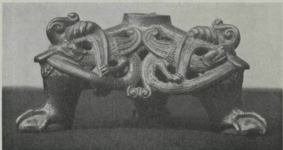
Fig. 6. \frac{1}{4} . Inv. 16390. Ha.