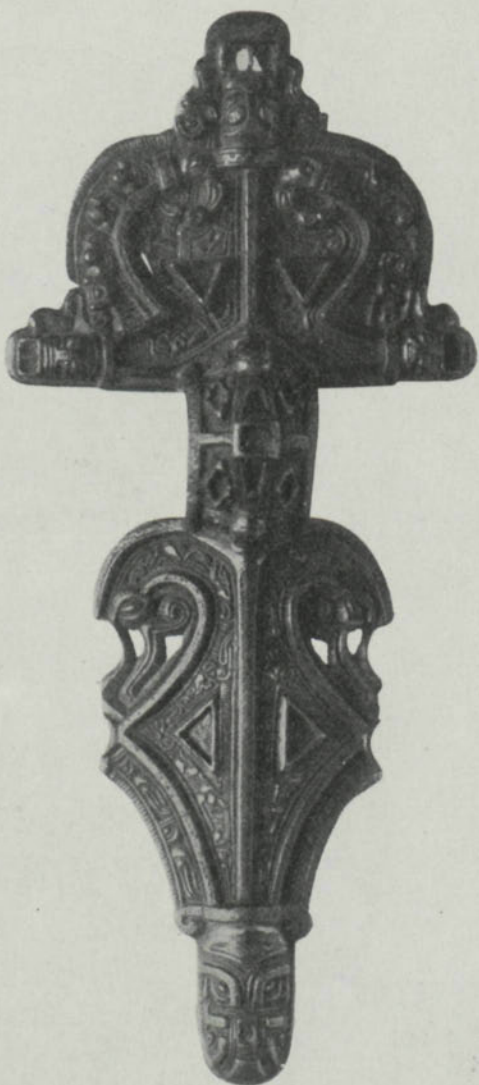
Fig. 3. 2/3. Inv. 16390. Öl.