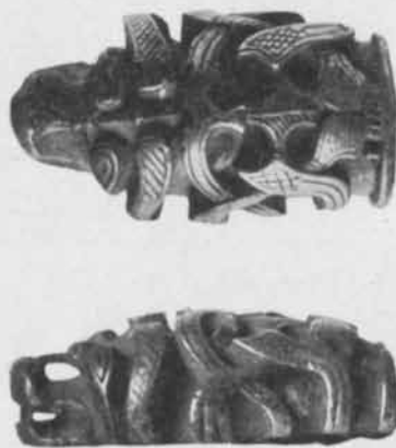
Fig. 1. \frac{1}{1} . Inv. 16390. Go.