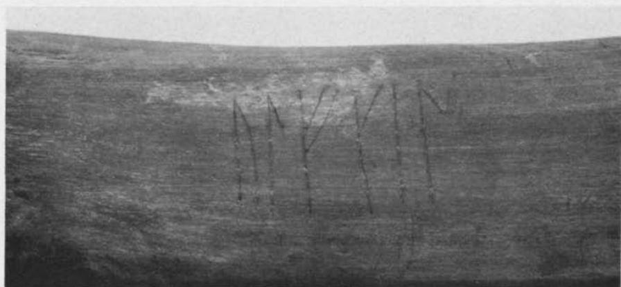
Fig. 1. Runinskrift på käpp från kv. Glambeck 4 i Lund, KM inv.nr 59126:795. — Runic inscription on a stick found at Lund.