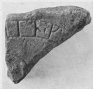
Fig. 5. Runstensfragment från V. Libby, Husby-Sjuhundra sn, Uppland. Foto N. Lagergren (ATA). — Fragment of rune-stone from V. Libby, Husby-Sjuhundra parish, Uppland.