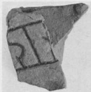
Fig. 6. Runstensfragment från Lohärads prästgård, Uppland. — Fragment of rune-stone from the vicarage, Lohärad, Uppland.