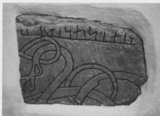
Fig. 2. Det nyfunna fragmentet av runstenen U 416 Norrsunda kyrka, Uppland. Foto Thorgunn Snaedal 1984 (ATA). — The newly discovered fragment of runestone U 416 at Norrsunda church, Uppland.

2. Fragmentet U 415 består av rödaktig granit med inslag av grått och svart pigment och