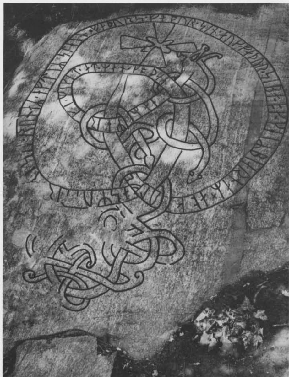
Fig. 1. Runhäll vid Bo gård, Lidingö, Uppland. — Rune rock at Bo gård, Lidingö, Uppland.

långt vittrat parti med rester av två runor. Av den första återstår nedre delen av en huvudstav och, sannolikt, ansättningen av vänstra bistaven av en n -runa. Av den andra återstår basen av en huvudstav samt högra bistaven och ansättningen av vänstra bistaven i en t -runa. Efter 7 r är ett 10 cm långt stycke av ytan kraftigt vittrat. Förmodligen har ett skil-