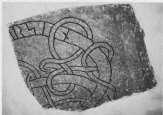
Fig. 3. Det nyfunna fragmentet av runstenen U 415 Norrsunda kyrka, Uppland. Foto Thorgunn Snaedal 1984 (ATA). — The newly discovered fragment of runestone U 415 at Norrsunda church, Uppland.

hårdare kristaller. Det har sannolikt utgjort nedre högra delen av en runsten med runinskriftens slut. Fig. 3.