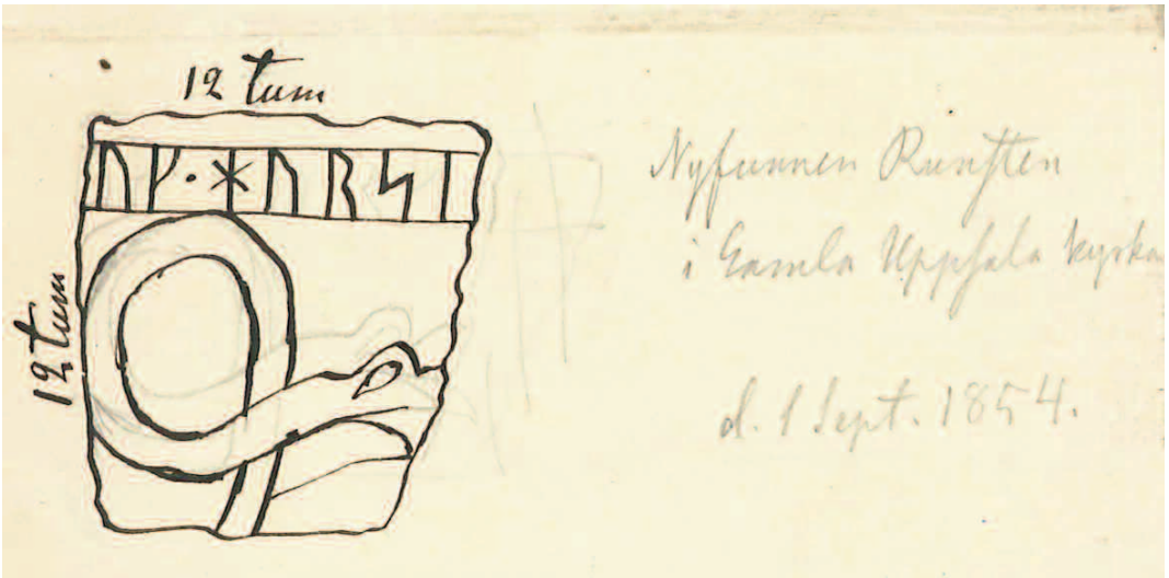
Fig. 1. Carl Säves teckning 1854 av ett runstensfragment i Gamla Uppsala kyrka, Uppland. Efter original i ATA. — An 1854 drawing of an early 12th century runestone fragment in the church of Old Uppsala.

I väggen till kyrkans södra kor finnes inmurad lemning af en runsten, af hvilken nu endast korstecknet är synligt. Ett annat stycke med några runor förvaras löst i kyrkornet, enligt benäget meddelande af studenten C. M. Bolm.