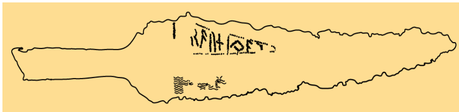
1. 'Prøver.' Spydspiss fra Øvre Stabu gård i Østre Toten, Oppland. 175–200 e.Kr.